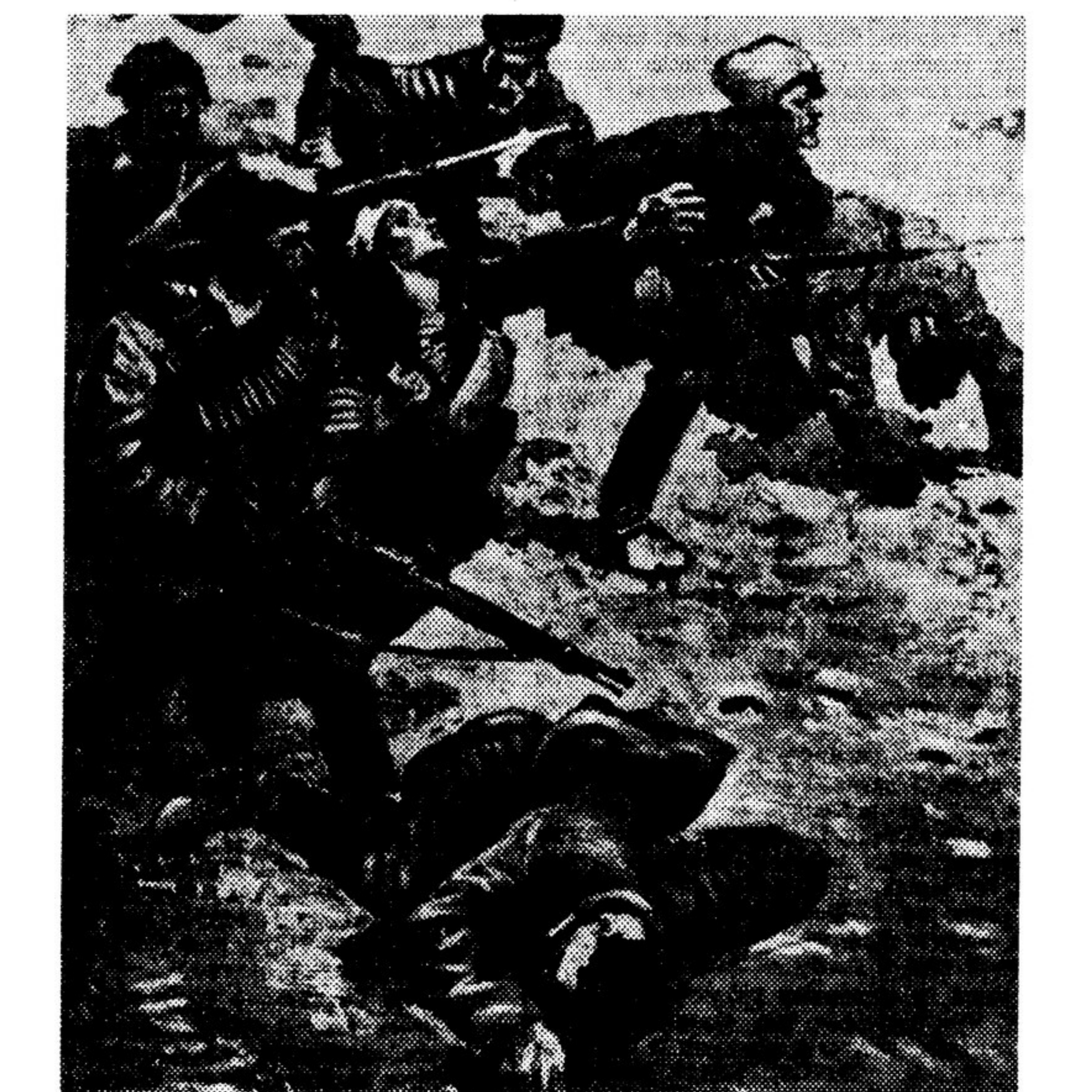
Фрагмент панорамы «Штурм Перекоп». «Отец и сын», работа художника В. Ефанова.

И не останавливается бурный людской поток, advancing укреплению с фронта. Это волнами идут части 51-й дивизии. Идут горняки и заводские с Урала — основатели дивизии, якутские и сибирские крестьяне, пролетарии из Москвы и Петрограда, татары и чуваша, набранные в Казани, доенские шахтеры.